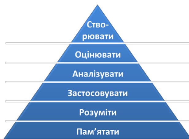
Рис. А.1. Піраміда цілей навчання

Більш деталізовану ієрархію цілей навчання запропоновано Бенджаміном Блумом. Таксономія Блума-Андерсон (рис. А.1) починається із простого результату «пам'ятати» і виростає до складної форми дії «створювати». Кожна наступна категорія класифікаційної схеми містить у собі більш низьку – так, категорія «розуміти» містить у собі поводження на рівні «пам'ятати» тощо.